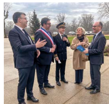
Accueil républicain à l'occasion de la visite de Sébastien Martin, ministre délégué chargé de l'Industrie (à droite sur la photo).

Lors d'un prochain conseil municipal, les élus proposeront de nommer le nouveau square en cours de réalisation devant l'EHPAD Vollat « Square Maxime Castagna ». D'autres lieux seront également dédiés à Maxime Marchandiau, maire de 1971 à 1977, et à Michel Lacroix, maire de 1979 à 1989.