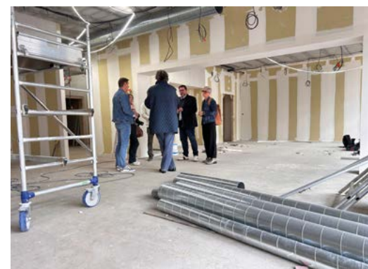
La construction d'un nouvel accueil de loisirs, pour un montant de 1 617 600€ TTC, touche à sa fin sur le site de l'école Le Launay.

Digoïn fait partie du Grand Charolais, une intercommunalité composée de 44 communes. Les compétences du Grand Charolais sont nombreuses et ses actions bénéficient au quotidien à l'ensemble des 40 400 habitants. Découvrez ci-après un aperçu non-exhaustif des actions menées en 2025 par Le Grand Charolais pour l'ensemble des communes, avec un éclairage particulier sur Digoïn.