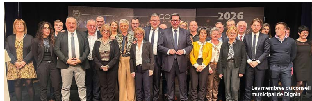
Les membres du conseil municipal de Digoïn