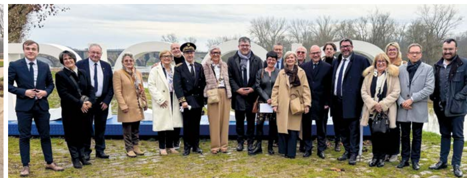
Une visite ministérielle placée sous le signe de l'écoute, du dialogue et de la coopération entre l'État et la ville de Digoin.