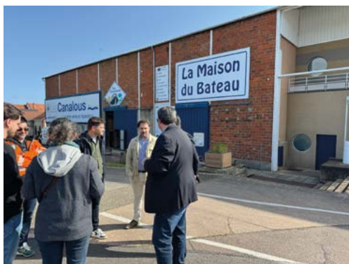
Suite aux dommages causés par la grêle en 2022, le bâtiment du port a fait l'objet d'une réhabilitation en 2025, pour un montant de 877 995 € HT.