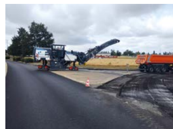
À Digoin, Le Grand Charolais assure l'entretien de 25 km de routes et de 4 ouvrages d'art. En 2025, quatre travaux de voirie y ont été réalisés pour un montant total de 37 679 € TTC.

90 acteurs locaux du monde agricole ont participé à l'Audit territorial piloté par Le Grand Charolais avec la Chambre d'agriculture pour soutenir les agriculteurs face aux défis actuels de la profession. La Communauté de communes a également organisé, le 15 octobre 2025, ses premières Rencontres de l'Agriculture à Palinges avec plus de 100 participants.