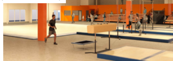
Futur espace gymnique dans l'ancien « Brico »