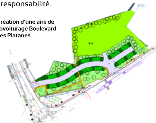
Création d'une aire de covoiturage Boulevard des Platanes