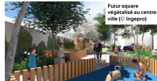
Futur square végétalisé au centre-ville