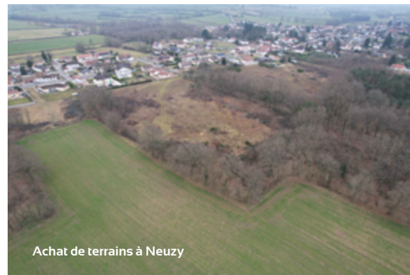
Achat de terrains à Neuzy

Enfin, un chantier emblématique débutera : la requalification du centre-ville, avec la transformation de l'ancien complexe « Vollat » en square urbain végétalisé, véritable poumon vert en cœur de ville. Ces investissements sont rendus possibles grâce à notre engagement constant pour décrocher des subventions de nos partenaires. Ils répondent aux attentes des habitants et préparent l'avenir de notre ville avec ambition et responsabilité.