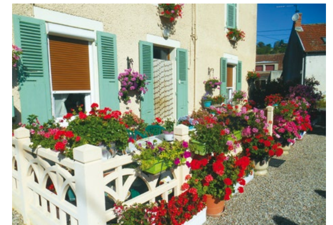
▲ 1 er prix « Façades de maison individuelle ».

En parallèle à cette action, la ville de Digoin s'est vue confirmer sa deuxième fleur pour la qualité de son esthétique florale en 2020 et ce grâce à la mobilisation des agents municipaux qui ont à cœur d'entretenir et d'embellir nos espaces verts. Et comme un bonheur n'arrive jamais seul, une autre bonne nouvelle est tombée il y a quelques jours pour apporter un peu de lumière en cette période toujours morose. La ville de Digoin a en effet remporté le premier prix des décorations de Noël en 2020.