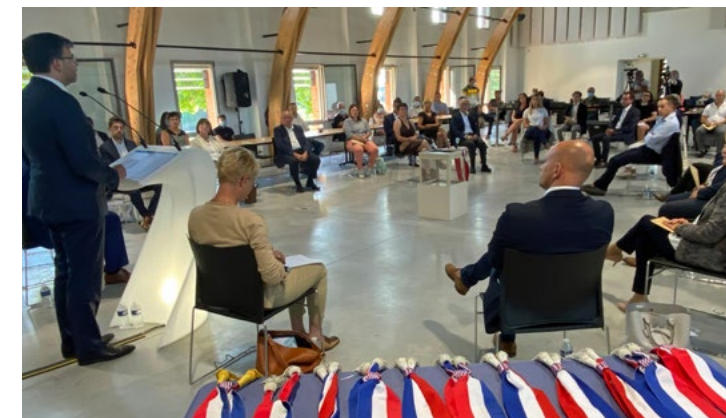
*Photographie prise en juin 2020 dans le respect des règles sanitaires de l'époque.

Alors que pour certains tout s'arrêterait, pour d'autres tout s'accélérait : nos professionnels de santé se sont retrouvés exposés et mobilisés. Et même si nous ne les applaudissons plus tous les soirs à 20h, nous savons ce que nous leur devons.