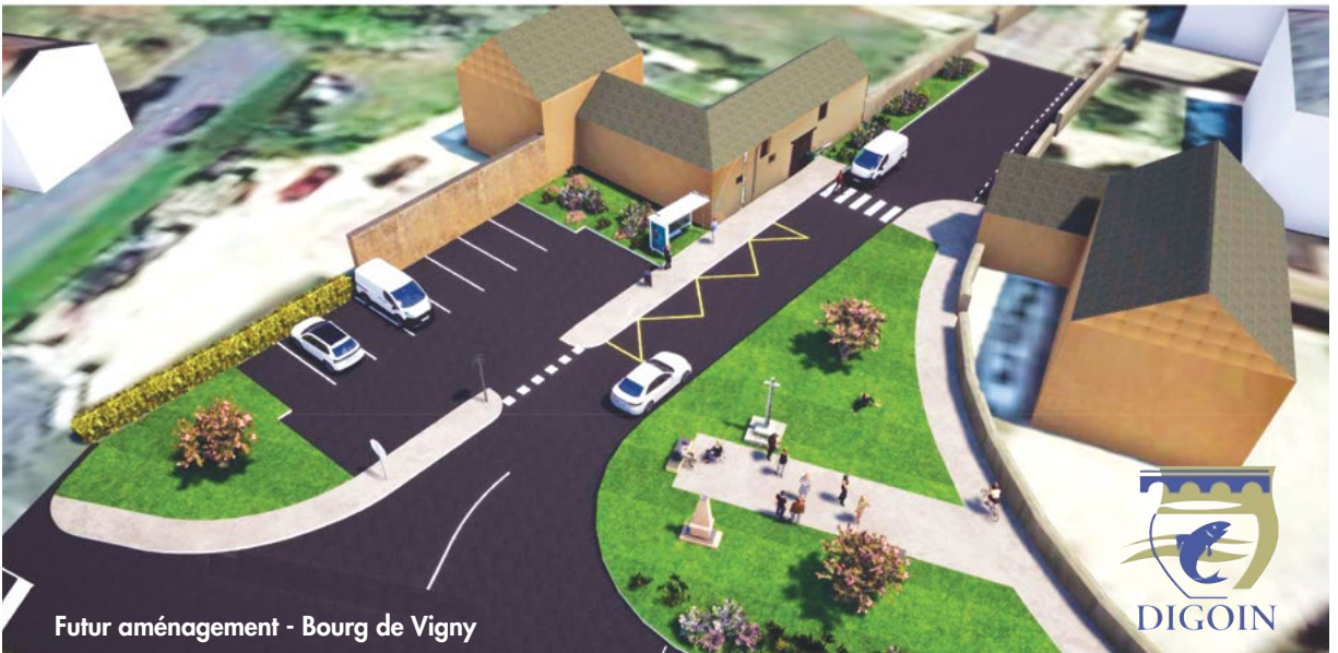
Futur aménagement - Bourg de Vigny

Budget 2021 : Digoïn se donne les moyens de ses ambitions