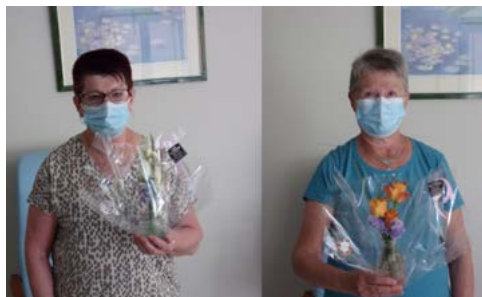
▲ 30 mai : comme chaque année, la résidence autonomie « La Fougeraie » a mis à l'honneur les mamans en célébrant La Fête des mères.