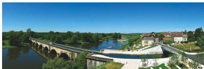
▲ Juin : Nouveauté de cet été ! Une webcam panoramique vient d'être installée au-dessus de l'Observatoire. Une autre façon de voir Digoin ! À retrouver sur : www.destination-saone-et-loire.fr