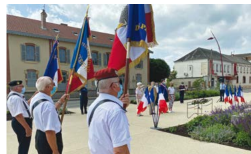
▲ 18 juin : élus, corps constitués, porte-drapeaux et membres d'associations patriotiques se sont rendus aux Monuments aux Morts à l'occasion du 81 ème anniversaire de l'appel du Général De Gaulle.