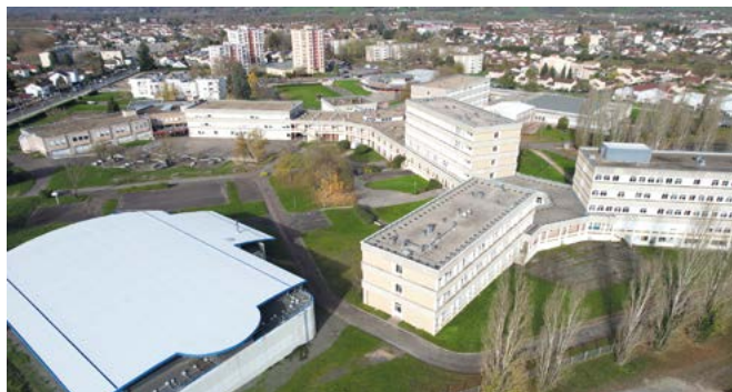
Les travaux engagés et ceux programmés en 2026 par le Département visent à réhabiliter durablement les réseaux d'eau de la cité scolaire, afin de garantir une distribution conforme aux normes sanitaires.

Ces interventions ont été accompagnées d'analyses régulières, dont les résultats sont consultables en toute transparence. Les contrôles menés en novembre et décembre ont montré que la quasi-totalité des points testés respectaient désormais les normes en vigueur, un léger dépassement ayant été rapidement corrigé. Ces résultats confirment une amélioration progressive de la qualité de l'eau. Le Département de Saône-et-Loire, qui a investi plus de 147 000 € depuis le début de l'épisode, prévoit en 2026 des travaux complémentaires pour réhabiliter les portions de réseau concernées et garantir une eau potable de manière pérenne.