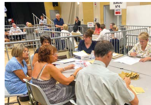
Les Digoinois sont appelés aux urnes le 15 mars salle des Fêtes et salle de Vigny pour élire leur conseil municipal. Le dépouillement aura lieu à partir de 18h.

C'est pour cette raison que le bulletin de vote comportera deux colonnes distinctes : une première colonne pour les conseillers municipaux (29 + 2 remplaçants) et une seconde pour les conseillers communautaires (11 + 2 remplaçants). Cette organisation reflète la double dimension de l'élection : une représentation au niveau communal, pour la gestion des affaires locales, et une représentation au niveau intercommunal, pour les compétences partagées telles que le développement économique, l'aménagement du territoire, l'environnement ou certains services publics.