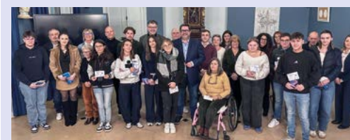
Remise de cartes aux jeunes Digoinois

Le 13 février dernier, la ville de Digoin a accueilli en mairie une dizaine de jeunes Digoinois nés en 2007 et 2008 pour la cérémonie de citoyenneté, marquant leur entrée officielle dans la vie civique. À l'occasion de cette première étape citoyenne, chaque jeune a reçu sa carte électorale et le livret du citoyen, symboles de son droit de vote et de son engagement civique. Ils pourront utiliser cette carte dès les prochaines élections municipales prévues à la mi-mars, marquant ainsi leur entrée dans la vie démocratique locale. La cérémonie, organisée en présence des élus du conseil municipal, de membres de la commission « élections » et d'une délégation locale des donneurs de sang, a rappelé l'importance du vote, des valeurs républicaines et de l'engagement sous toutes ses formes. Le don du sang a notamment été présenté comme une action concrète et accessible dès la majorité. La rencontre s'est conclue par un moment convivial réunissant les jeunes et leurs familles autour de cette nouvelle étape de leur citoyenneté.