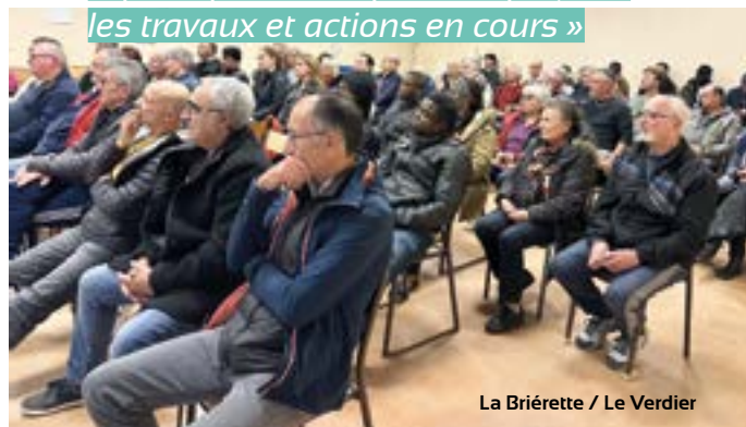
La Brièrette / Le Verdier

« Il est important d'aller à la rencontre des habitants pour leur présenter la politique municipale, les projets, les travaux et actions en cours »