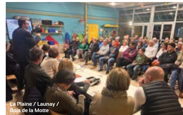
La Plaine / Launay / Bois de la Motte