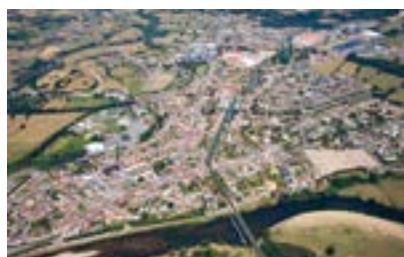
Brièrette, Neuzy, Centre-ville, Verdier... ce sont l'ensemble des habitations du territoire communal qui ouvre droit à ce dispositif.

L'hiver s'installe et au moment où les factures énergétiques augmentent, il est conseillé de bien s'isoler pour réduire sa consommation. À cet effet, la Communauté de communes Le Grand Charolais s'est lancée depuis 2021 dans une vaste opération d'amélioration de l'habitat dite OPAH. Ce dispositif permet de soutenir financièrement les propriétaires bailleurs ou occupants, souhaitant engager des travaux en la matière : économies d'énergie, maintien à domicile, travaux lourds, lutte contre l'habitat indigne... Cette opération est renouvelée jusqu'au 2 novembre 2025. Dans la continuité de ce dispositif, qui rencontre un réel engouement (243 dossiers engagés sur l'ensemble du Grand Charolais depuis le lancement de ce dispositif, dont 60 sur Digoin), et des nombreuses actions complémentaires engagées par la municipalité de Digoin afin de contribuer à son embellissement, la ville de Digoin s'inscrit dans cette dynamique partenariale en prolongeant également son dispositif d'accompagnement financier destiné à soutenir les particuliers souhaitant procéder à des travaux de leur façade d'habitation. Tout projet de ravalement de façades d'immeubles de plus de 10 ans, situés sur l'ensemble du territoire communal, ouvre droit et sous conditions à une subvention de la ville liée à cette opération. La Communauté de communes pourra également compléter ces aides sur les habitations situées exclusivement sur une certaine zone (périmètre disponible sur digoin.fr. ou sur legrandcharolais.fr).