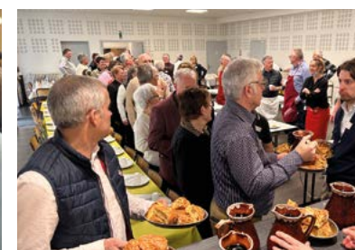
Des bénévoles aux petits soins des convives.