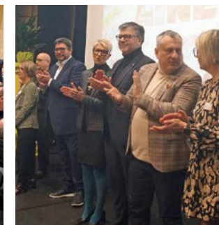
De profonds remerciements pendant les discours.