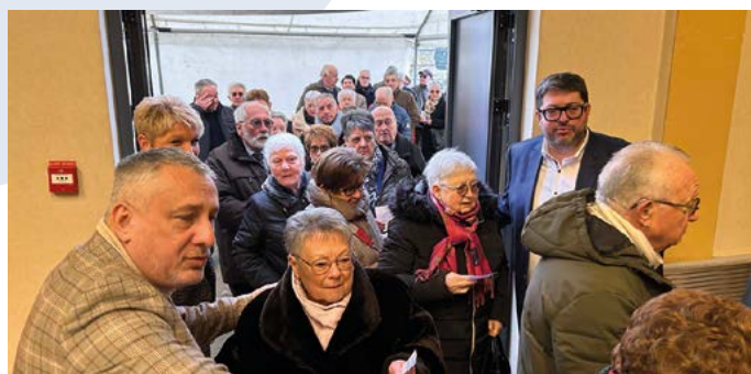
Les aînés accueillis par les élus de la commune.