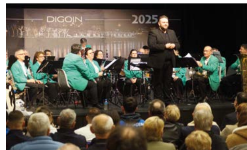
Après une ouverture en musique avec l'Harmonie de Digoin, le Maire a présenté ses vœux à la population.

Avec l'équipe municipale, nous n'aurons de cesse de nous mobiliser et de nous battre pour porter les ambitions fortes de Digoin. Soyons fiers de notre ville, soyons fiers de notre identité, de notre territoire et continuons de participer activement à l'attractivité de la Saône-et-Loire, du Grand Charolais et de Digoin. Excellente année 2025 !