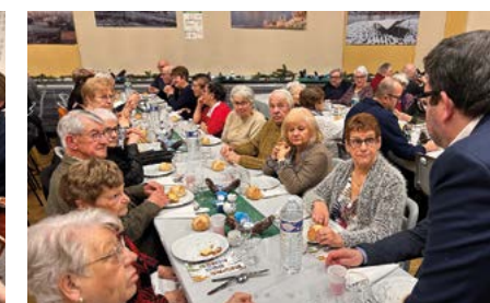
Outre les habitués qui apprécient la convivialité du moment, d'autres "nouveaux" aînés sont venus partager un bon moment.