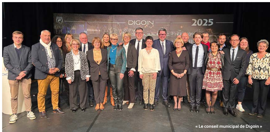
« Le conseil municipal de Digoin »

lotissements. Et puis il y a des projets sur lesquels nous travaillons, comme la résidence à Bartoli, au cœur du centre-ville. Les discussions se poursuivent aussi avec l'office HLM de Saône-et-Loire, l'OPAC, en particulier avec son président concernant la "Résidence-autonomie de la Fougeraie". Les travaux de rénovation que nous conduisons renforcent son attractivité.