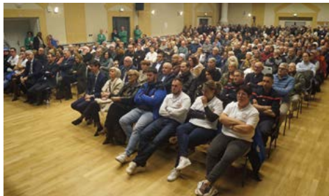
Près de 400 personnes sont venues assister à la cérémonie des vœux 2025.

Qu'elles soient culturelles, sportives, patriotiques, chacune d'entre elles fait preuve de dynamisme et d'entraide à l'image de la nouvelle équipe de l'office municipal des sports et de la Vie associative.