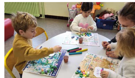
Dans la continuité des étés 2023 et 2024, l'accueil de loisirs de Digoin est désormais géré par Le Grand Charolais depuis le 1 er janvier 2025.

Depuis le 1 er janvier 2025, l'accueil de loisirs (accueil des mercredis, petites et grandes vacances...) est désormais une compétence intercommunale.