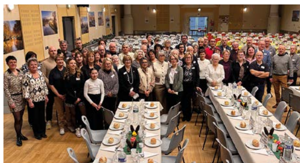
C'est une brigade de 69 bénévoles - dont 17 conseillers municipaux - qui ont contribué à la belle organisation de ce moment.