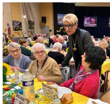
Au-delà d'un simple repas, cet événement constitue un moment unique de partage et d'échanges entre nos seniors et les élus.