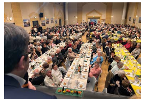
Le repas était confectionné cette année par la Maison Parot, le dessert préparé par « L'épi de Louis » et le pain et les brioches fournis par « Le Fournil de Sophie ». Les vins ont été choisis aux « Arômes du Canal ».