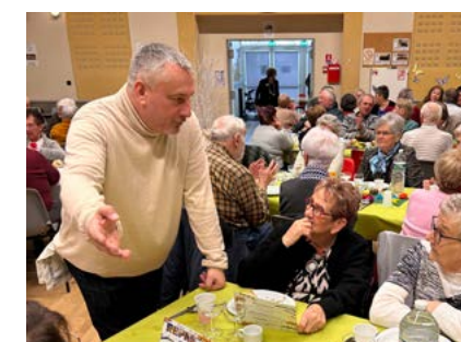
Ce moment aura permis, une nouvelle fois, de démontrer l'attachement de la Ville de Digoin à ses aînés.

IMPORTANT : Chaque année, le « repas des aînés » se déroule courant janvier. Un courrier d'invitation est adressé à toutes les personnes résidant à Digoin et ayant plus de 75 ans. Si vous n'en avez jamais été destinataire (changement d'adresse, nouvel habitant...), n'hésitez pas à contacter la mairie au 03 85 53 73 00 afin de vous pré-inscrire sur notre listing. Le formulaire d'inscription vous sera adressé second semestre 2025.