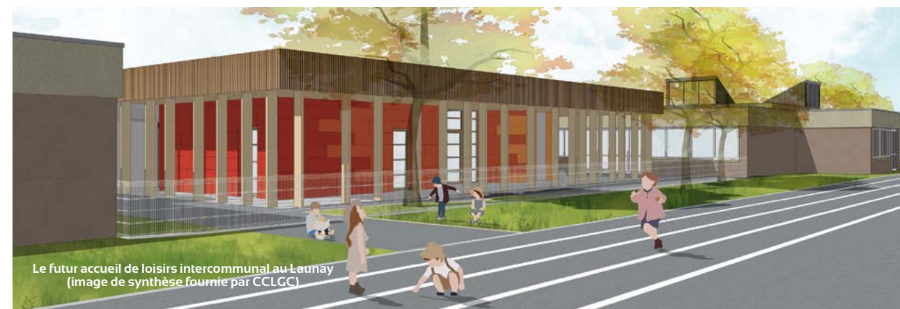
Le futur accueil de loisirs intercommunal au Launay (image de synthèse fournie par CCLGC)

Après expérimentations sur les saisons estivales 2023 et 2024, la construction d'un nouvel accueil de loisirs sur le site du Launay s'avérait plus pratique pour les enfants et plus accessible pour les familles du territoire. Sur un espace de plus de 335 m 2 , la construction de ce nouvel accueil de loisirs intercommunal prendra place entre les deux bâtiments des écoles (élémentaire et maternelle). Ce projet, porté par Le Grand Charolais et conçu en collaboration avec la ville de Digoin permettra à terme de mutualiser les locaux comme les salles de restauration et de sieste, pour un investissement raisonné.