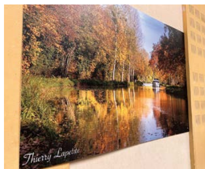
La plupart des photos placées en décoration ont été réalisées par le photographe amateur Thierry Lapetite.