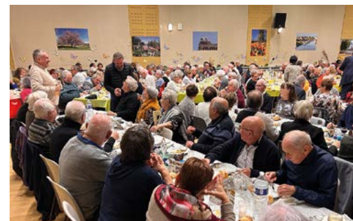
Toujours un bonheur pour les seniors de se retrouver le temps d'une journée autour d'un repas festif !