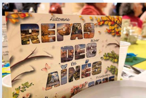
Sur le "thème des 4 saisons", chaque table a donc été pensée aux couleurs d'une saison. Tous les chemins de table ont été fabriqués par les enfants du CAM (centre d'animation communal).

Le traditionnel repas des aînés a réuni le dimanche 19 janvier dernier plus de 350 convives de plus de 75 ans à la salle des Fêtes. Avec de nombreux sourires sur les visages, nos aînés ont savouré le repas offert par la ville de Digoin et le CCAS. Retour en images.