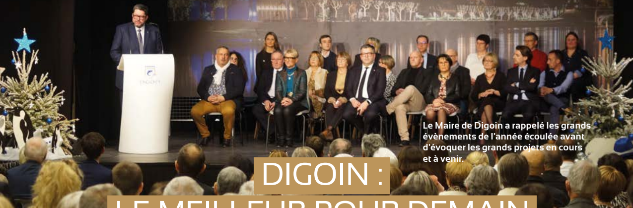
Le Maire de Digoin a rappelé les grands événements de l'année écoulée avant d'évoquer les grands projets en cours et à venir.