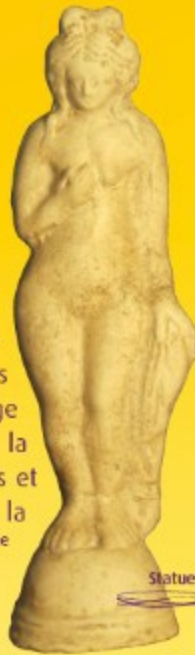
Statuette de déesse

Au fil du temps, les techniques se précisent, les décors apparaissent, d'abord sculptés puis imprimés ou peints. La fusion mythique des Eléments donne des oeuvres d'art !