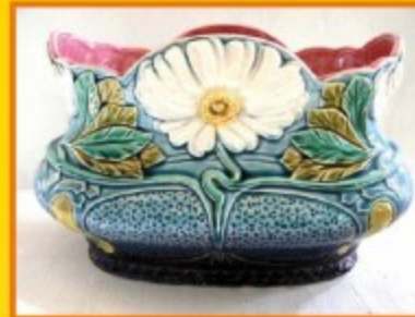
Barbotine année 1900

Au travers des collections et des oeuvres de céramique exposées, c'est au savoir-faire et au travail des faïenciers digoinais que l'on rend hommage.