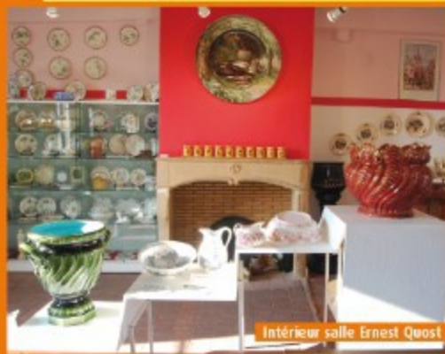
Intérieur salle Ernest Quost