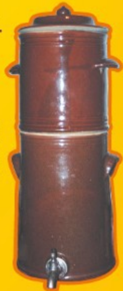
Cafetière en grès utilisée par les collectivités